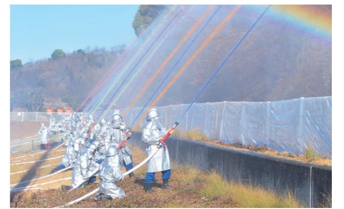
▲毎年1月に行われる消防出初式では、8色の一斉放水を披露しました。