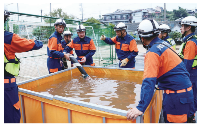
▲9月1日に行われた尾道市防災訓練にも参加し、コンクリートミキサー車を使った生活用水給水訓練などを行いました。