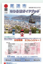
ごみ分別ガイドブック