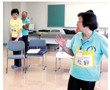
▲ 2級指導士養成講習では、1級指導士が講師となります。