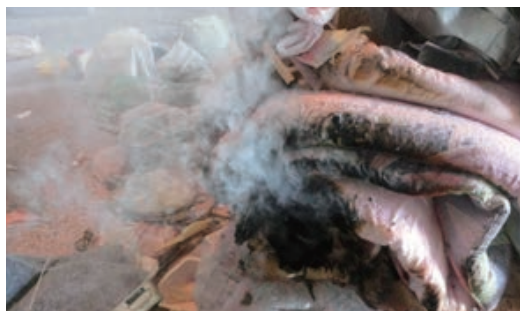
▲ 収集車の中で発火するおそれもあり、大変危険です。

使い切っていないライターや、乾電池の入ったままのストーブなどがごみに出されていました。ライターは、収集車の中で容器が押しつぶされ引火性の強いガスが漏れ出すと発火しやすくなったり、乾電池が入ったままのストーブは点火スイッチが作動すると発火したりします。ストーブは、本体に灯油が残っていることもあるので、注意が必要です。