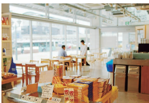
1階にはお土産物やフードコートが