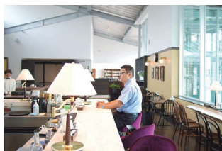
2階のカフェでのんびりとくつろぐ

新しい尾道駅は鉄道を利用される方だけでなく、待ち合わせやショッピングなどにもご利用いただけます。地域の皆さまや観光で訪れる方々たちが、行きかい交じり合う場所として、尾道に新たな賑わいを生み出すことができると嬉しいです。ぜひお気軽にお立ち寄りください。