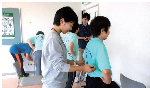
▲効果検証のため、県立広島大学が測定を行いました。