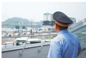
デッキから見る景色が大好きです(駅長談)

はじめて尾道駅の改札から出た瞬間は、衝撃が走りました!目の前に飛び込んできた尾道水道の風景に感動し、気が付いたら駅の事務室を素通りして(汗)駅前芝生広場に立ちつくしていました。3カ月経った今でも、町と海と山、島がギュッとつまんだ尾道の風景が大好きです。つつい景色を眺めながらメタボ解消も兼ねて歩いて移動してしまいますが、古いもの新しいものが入り混じる尾道の街の息遣いを感じますね。