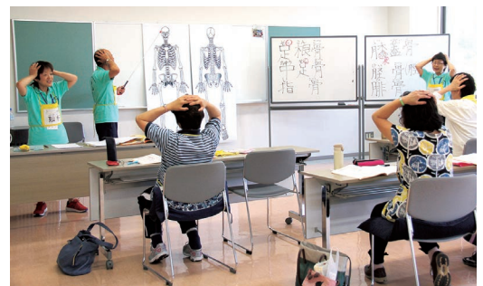
▲ 体を触りながら、骨や筋肉の役割を理解します。