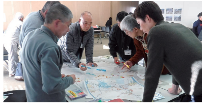
▲災害図上訓練では、地図を使って身近な危険箇所を把握します。

尾道市では、地域防災力の向上に取り組むため、今年から地域防災担当主幹2人を新たに配置しました。「自主防災組織の設立方法が分からない」「どんな防災活動をしたらいいのかわからない」など、防災の取り組みについてお気軽にご相談ください。