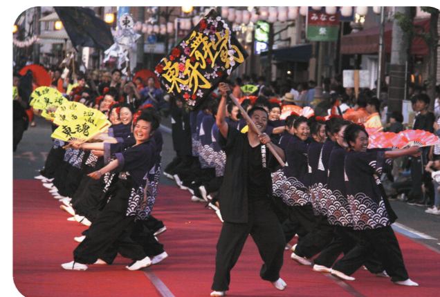
▲昨年の「第17回ええじゃんSANSA・がり」グランプリ部門優勝の尾道東高等学校