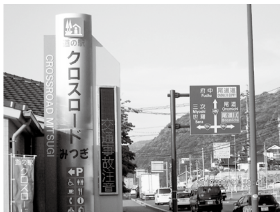
国道486号線の様子 (※道の駅クロスロードみつぎ前の地点より撮影)

市長 地域で行われた、アンケート調査の内容や結果を参考にし、国道486号及び市道神貝ヶ原線の道路整備を進めて行く中で、周辺の土地利用などについて、様々な機会をとおして、地域の皆様のご意見やご要望をお聞きしてまいります。