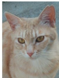
術後の野良猫は片耳をVカットしています

野良猫に餌をあげている人へ 安易に餌を与えると、飼い主のいない不幸な子猫を増やすことになります。無責任な餌やりはやめましょう。