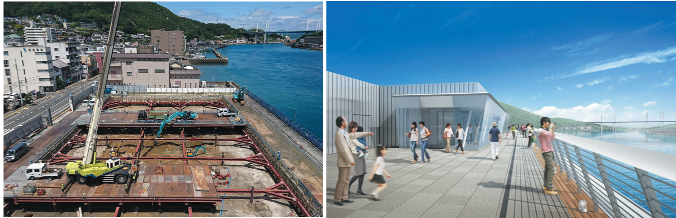
(平成30年6月の様子:地下工事を行っています。) 新本庁舎イメージ(屋上展望デッキから尾道水道を望む)