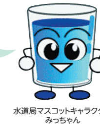
水道局マスコットキャラクター みっちゃん